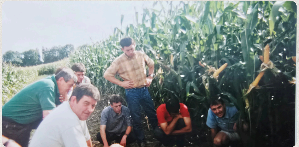
Réunion CETA des Baïses - 2001

Au travers de trois regards — Axes de travail en réunion CETA, Culture technique et rôle de l'ingénieur — et Témoignage d'un ancien collaborateur, replongeons dans ce qui fait l'ADN du conseil CETA : un savoir collectif vivant, en constante évolution.